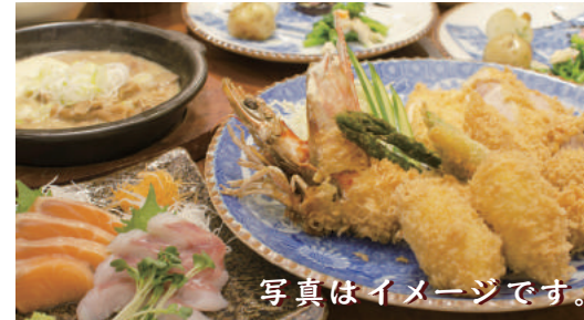
写真はイメージです。