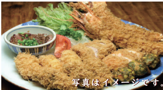
写真はイメージです。