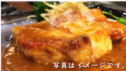
写真はイメージです。